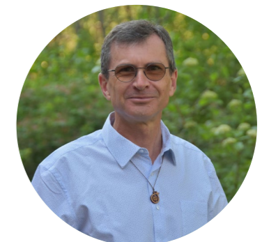
P. Christian Stranz